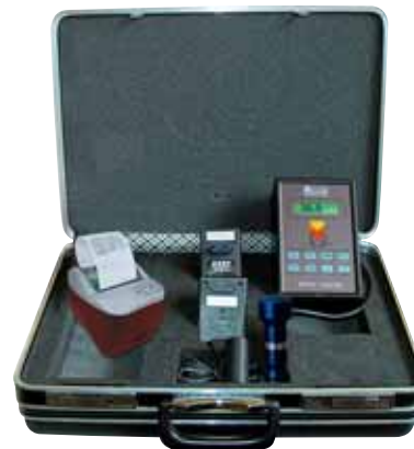
Kit accessoires complet avec imprimante