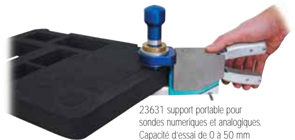
23631 support portable pour sondes numériques et analogiques. Capacité d'essai de 0 à 50 mm