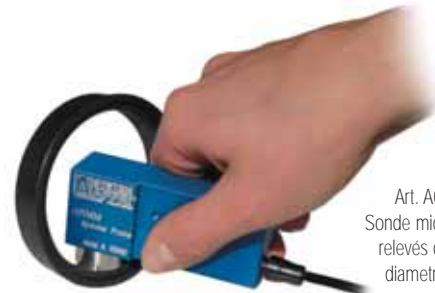
Art. A078.A1.080 Sonde micro A pour faciles relevés dans les tuyaux diamètre min 45 mm ou sur roues