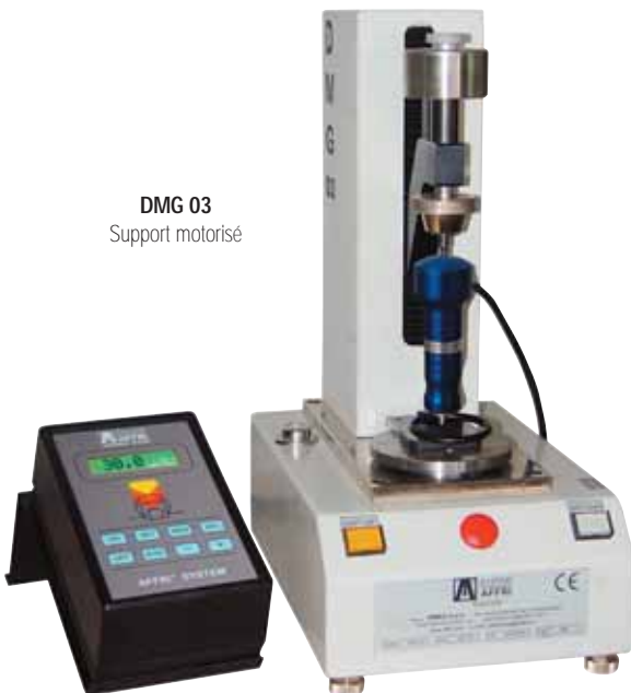
DMG 03 Support motorisé