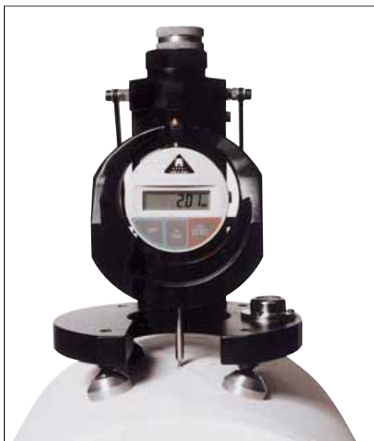
pour bobines de papier et cellulose