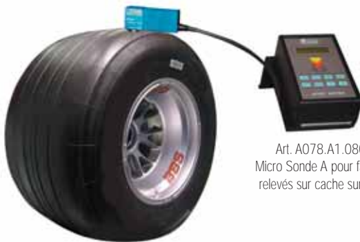
Art. A078.A1.080 Micro Sonde A pour faciles relevés sur cache surface